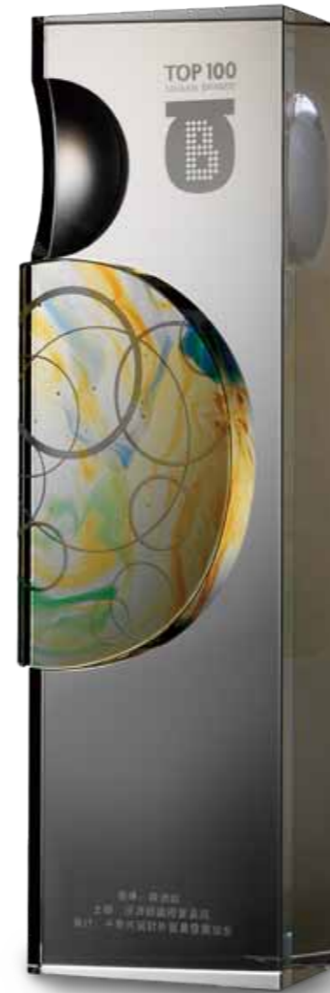
光的華彩 ——「台灣百大品牌選拔活動」榮譽獎座 環環相扣的力量，冉冉上升，生生不息。 匯聚、創新、突破，光的華彩， 成就 TAIWAN Brands，非凡榜樣。

為慶祝台灣建國百年，經濟部國貿局回顧台灣品牌發展歷程，為彰顯台灣企業經營品牌之成就，盛大舉辦「台灣百大品牌選拔活動」，期望透過百大品牌的甄選，凝聚企業及消費者關注及共識，進而提升台灣品牌形象與競爭力。