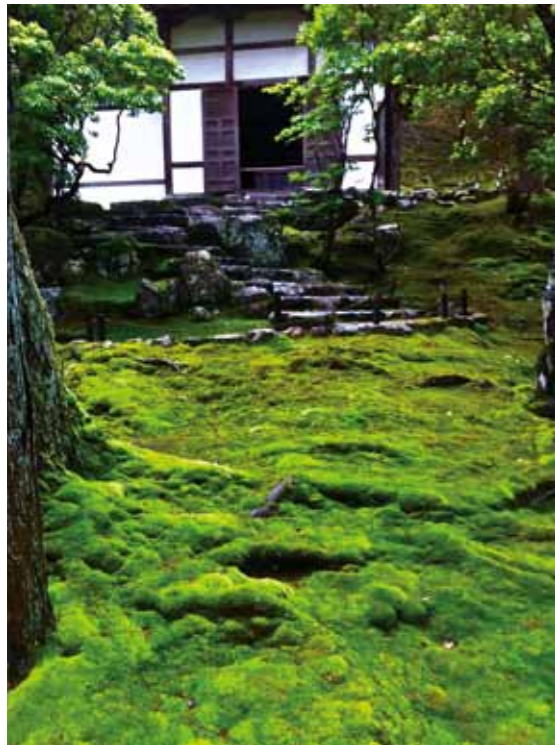
日本京都西芳寺，又名苔寺，寺內一景。

大雨之後，空氣陰翳，青苔飽滿，深綠更綠。號稱有一百二十餘種青苔的苔寺，鮮少人知道它叫西芳寺。雖在京都，卻少有人入寺參觀，當然，和嚴格要求事先預約有關，而且蓄意放話，至少一周才能取得預約回覆。這些繁瑣，把人馬雜沓之慮，完全屏除。