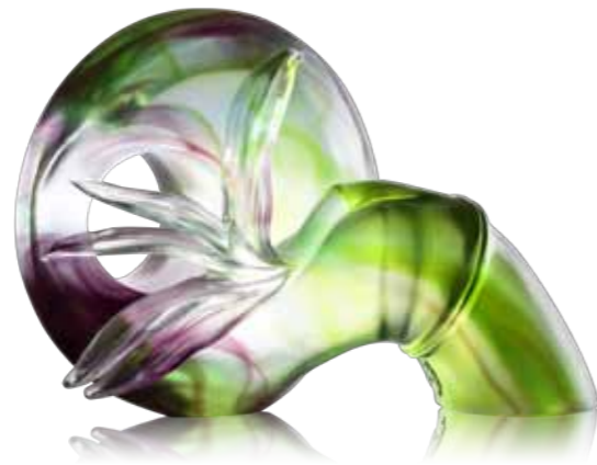
開運節節昇 Endless Steps of Luck