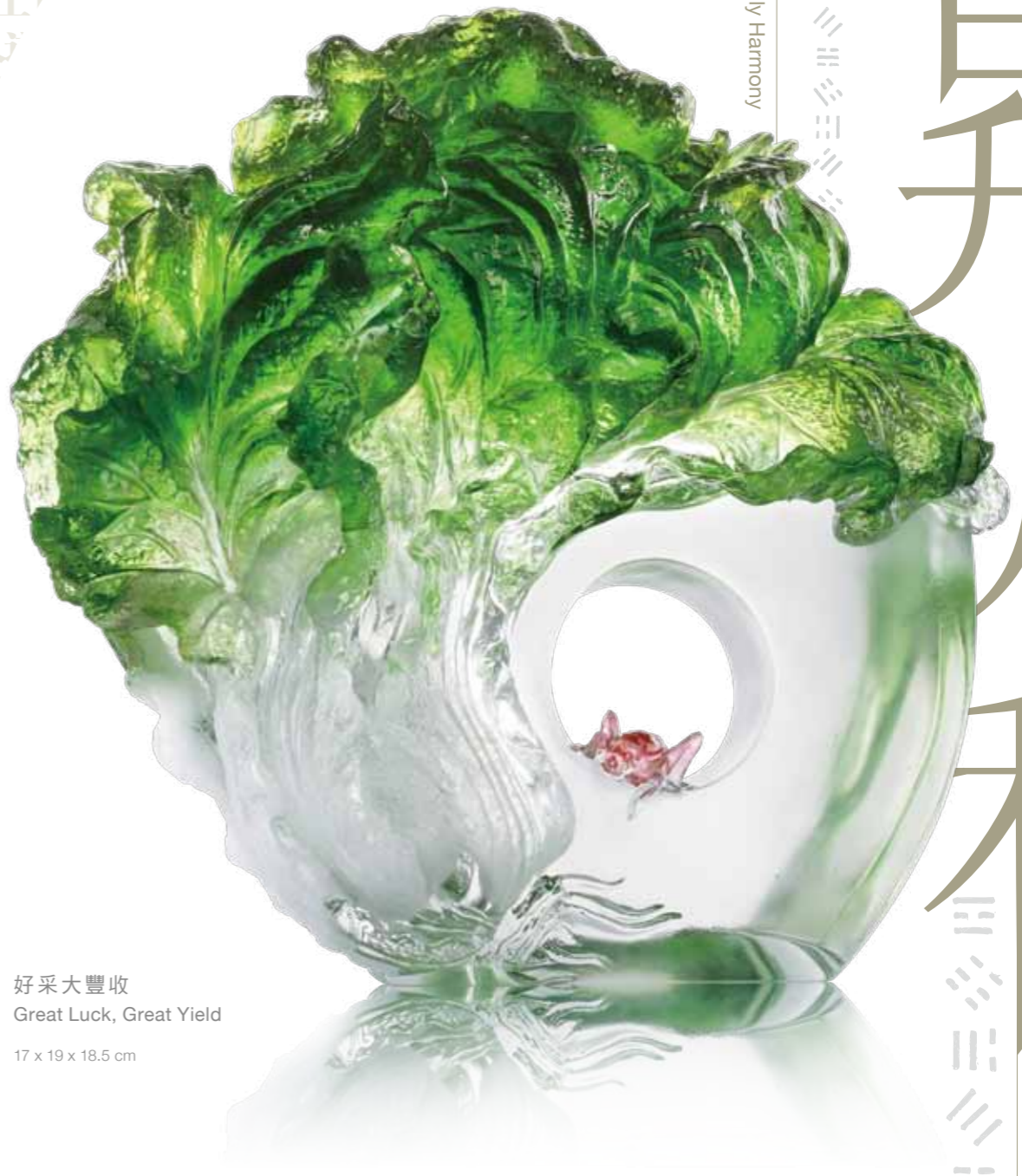
好采大豐收 Great Luck, Great Yield 17 x 19 x 18.5 cm

Ascending Qi Gives Rise to Earthly Harmony