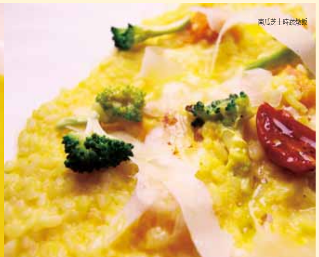
南瓜芝士時蔬燉飯