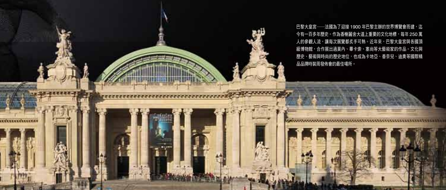
巴黎大皇宮——法國為了迎接 1900 年巴黎主辦的世界博覽會而建，迄今有一百多年歷史。作為香榭麗舍大道上重要的文化地標，每年 250 萬人的參觀人流，讓每次展覽都炙手可熱。近年來，巴黎大皇宮與各國頂級博物館，合作展出過莫內、畢卡索、塞尚等大藝術家的作品。文化與歷史、藝術與時尚的歷史地位，也成為卡地亞、香奈兒、迪奧等國際精品品牌時裝周發佈會的最佳場所。

楊惠姍的作品，傳達生命的關懷與醒悟，超越語言、文化與宗教。愛與慈悲，是世界共通的語言；也是生命裡，最最平凡深切的渴求。