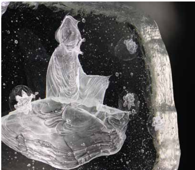
如果琉璃可以做成佛像，我們希望有一天看到佛像「身如琉璃，內外明徹」

一個人如果經歷過這樣的事，無論你是天主教還是基督教徒，你會想問：為什麼？今天這個社會是什麼？我們活在這裡，我跟每一個人的關係又是什麼？生，老，病，死，貪，嗔，痴，慢，疑的這些不安挫折，活著為什麼有這麼多不安？這些問題愈來愈多，也愈來愈迫切。