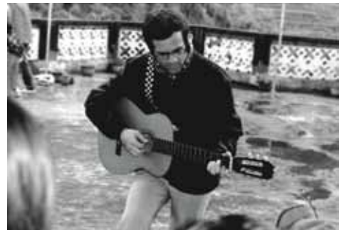
小丁神父來臺灣前，最怕沒有「音樂」。上船時，帶了一把吉他。初到臺灣，常以音樂會友，頗有「嬉皮」風格。