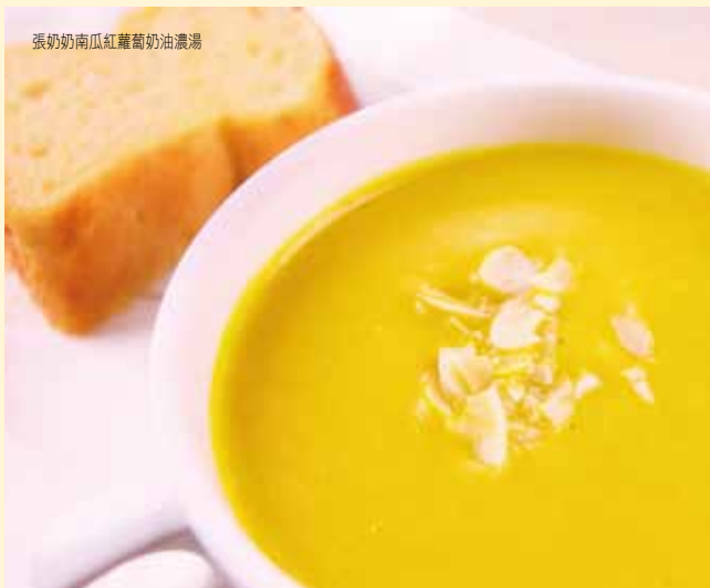
張奶奶南瓜紅蘿蔔奶油濃湯