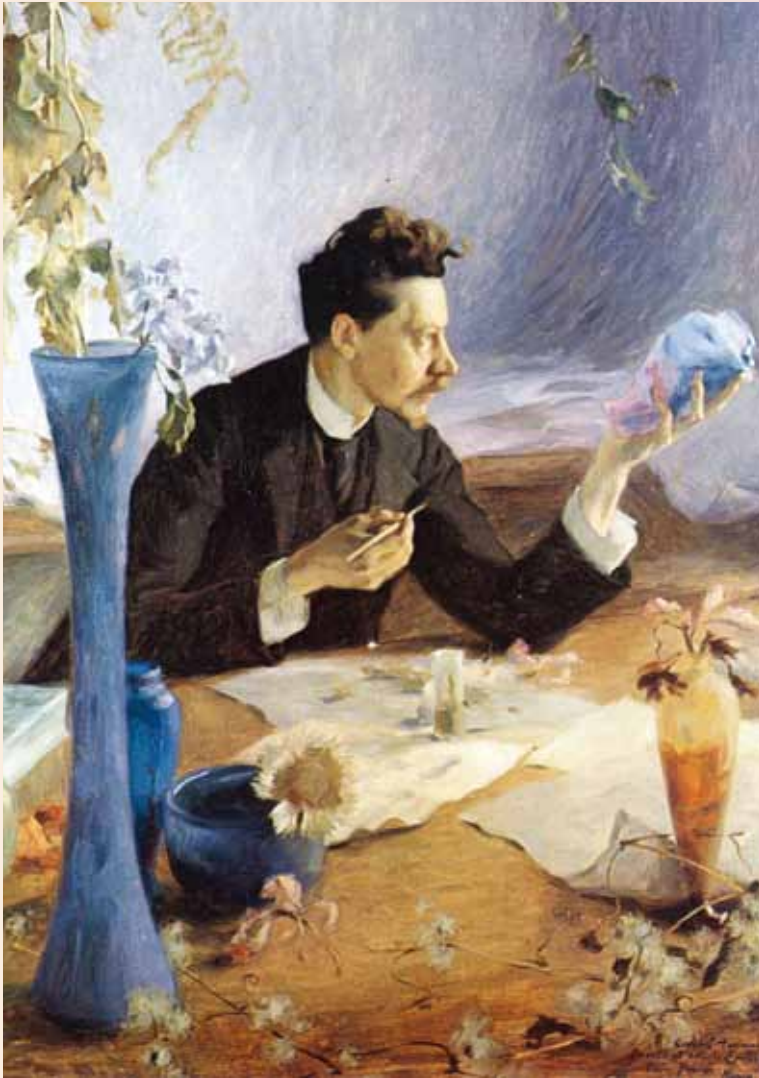
Émile Gallé 的畫像，做畫者 Victor Prouvé 是 Gallé 的好友，這是一幅少見的 Gallé 工作畫像。南錫學院博物館收藏。

知道琉璃的創作技法，Gallé幾乎無一不精熟，這個一生對昆蟲、植物和園藝有著無比狂熱的清教徒，植物花卉之美，是上帝的光華，投入琉璃的創作，是為了能夠彰顯那一朵百合花，一支玫瑰，甚至一隻蜻蜓的精妙，任何造型、顏色的試驗，他無不全心追求，因為，那是對上帝創造的世界的禮讚和謳歌。